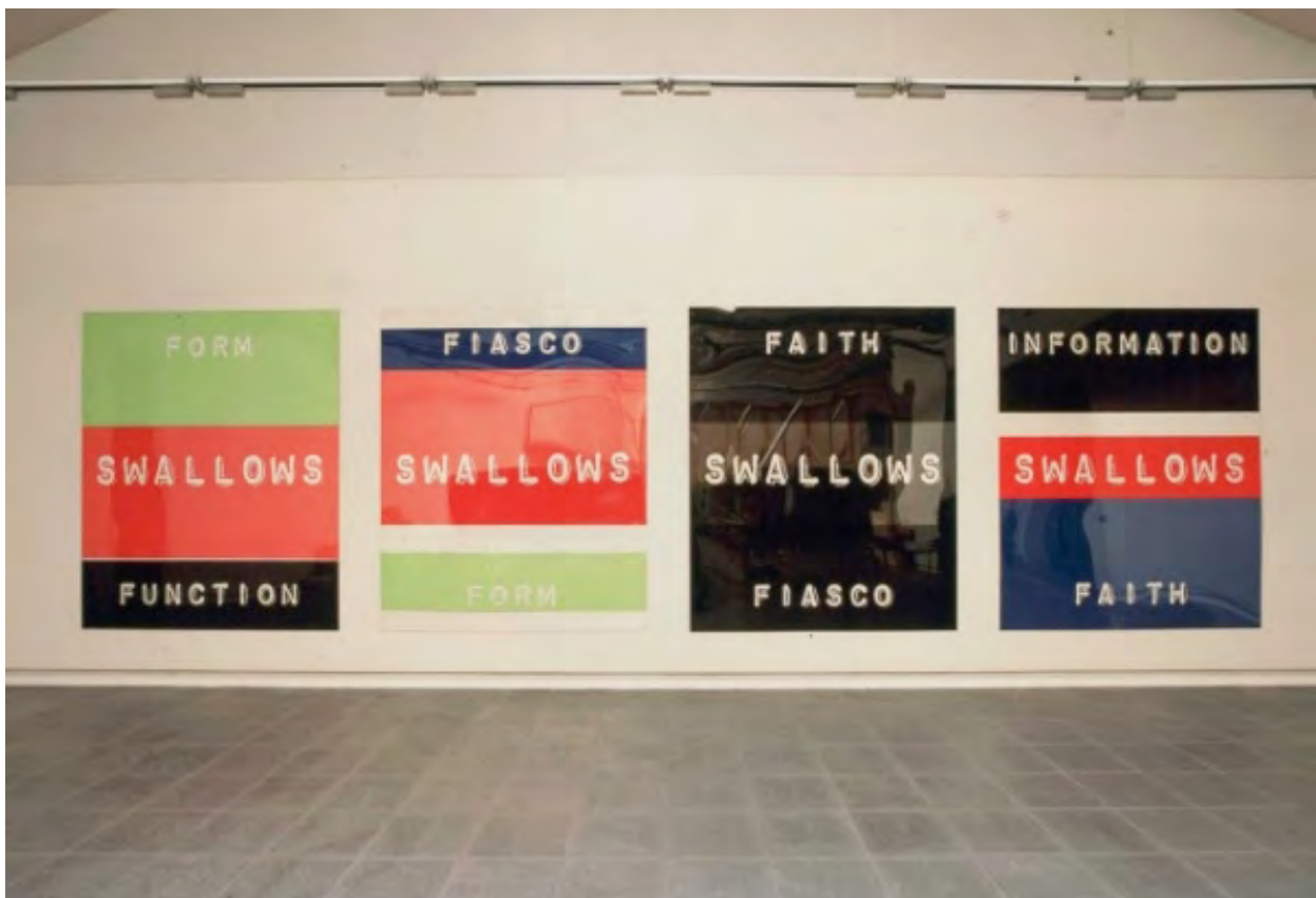
Following/ Swallowing , 2001 esmalte sintético, tornillos y metacrilato / total instalación 230 x 850 cm

Partiendo de su doble formación en la práctica de la pintura y la fotografía Pep Agut enfoca muy temprano su interés por los problemas de la representación, el papel del artista y el lugar del arte. Entendiendo el espacio del arte como el espacio público por excelencia más allá de toda condición epocal o cultural particular y preocupado por la puesta en circulación de las producciones artísticas y los modos de producción de sentido, Agut desarrolla un complejo y personal proceso de trabajo que le permite imbricar su proyecto estético con el sentido político de su actitud. Pep Agut trabaja en sus proyectos desplegando su investigación sobre un amplio repertorio de técnicas, medios y conceptos para someter a estudio las ideas de su interés durante largos períodos de tiempo abordando cuestiones relativas a la representación, el lenguaje, la arquitectura, etc. Tras un arduo proceso de escritura, sobreescritura y borrado de toda forma de narración en primera persona, el artista elabora un complejo índice de modelos plásticos genéricos para la organización de su trabajo. Ello le permite mantener sus proyectos abiertos a nuevas investigaciones, sin someterlos a rígidas nociones de estilo y, sobre todo, permite evitar la producción sistemática de los artefactos que resultarían.