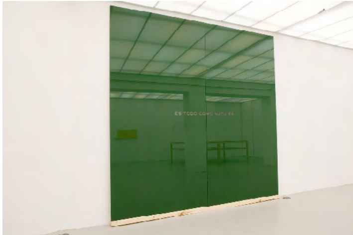
Es todo como nada es, 2004-2006 305 x 300x 12 cm cristal rotulado y madera