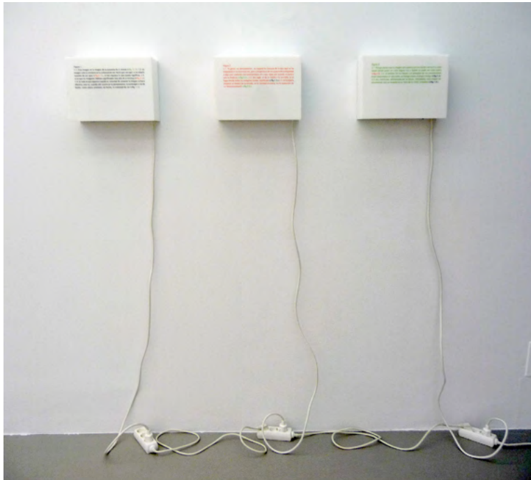
Sin titulo (sin tiempo), 2009 3 elementos de 21 x 31 x 15 cm c/u cajas de luz, impresión

Esta imagen es la imagen de la ausencia de sí misma. Solo se sostiene en tu voluntad de ver. No lo que ves aquí -o no estaría ausente de tus ojos-, ni tan siquiera lo que pueda significar (si es que las imágenes significan otra cosa más que sí mismas), sino aquello que aparece cuando tu voluntad de sostener la imagen se hace efectiva, esto es, cuando ello ocurre en tu pensamiento, la sostengas o no de hecho, como ahora sostienes, de hecho, tu voluntad de ver. Tu gesto -tu pensamiento-, no supone la clausura de lo que aquí se ha empezado ni su continuación, pero sí la apertura de un espacio de contigüidad a algo que comenzó con anterioridad a él y que sigue aún cuando te parece que lo finalizas. Ese lugar es el de las cosas visibles, el lugar donde habitan todas las imágenes, aquel que, no obstante, queda oculto siempre a nuestros ojos, en su claridad, en su naturaleza expansiva, descentrada. Porque parece que la imagen solo aparece en ese vaivén, en ese ir y venir desde donde pudo ser vista por última vez hasta donde no pudo ser vista nunca. Así, entrevista, estremecida por tu deseo, interpelada, esta imagen en movimiento (pues el temblor de tus manos y el parpadeo de tus pensamientos están enquistados en su naturaleza como un tiempo anexo al propio tiempo) vale un instante en la hora de la visión verdadera.