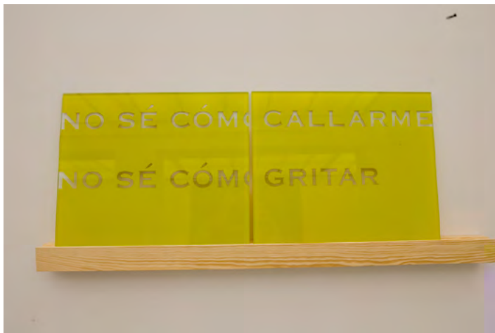
Callar, gritar, 2004-2006 42 x 120 x 5 cm cristal rotulado y madera